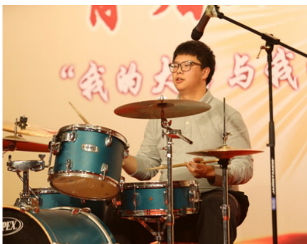
架子鼓表演展现经管学生文艺范儿