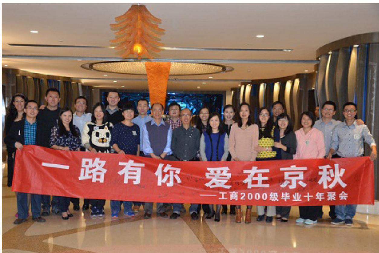
工商 2000 级毕业十周年纪念活动顺利举行