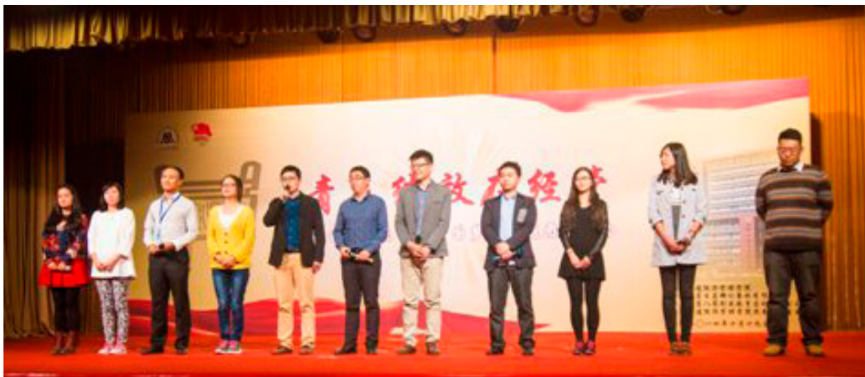
辅导员为核心价值代言