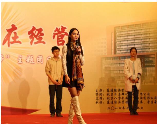
音乐剧：《明天就要报到了》