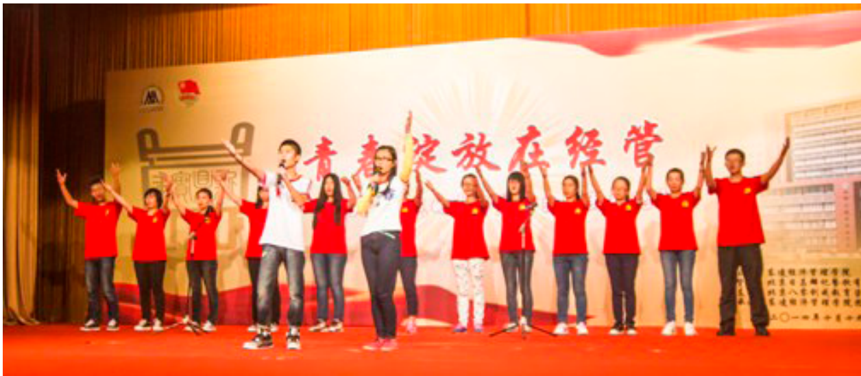
歌曲：《我的大学我的梦》