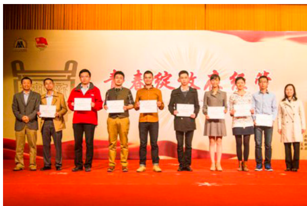
学院领导与校友成长导师合影

寄语学院全体新生。罗书记指出，习近平总书记用“人生的扣子从一开始就要扣好”的生动比喻，表明大学生在青年时期树立和养成正确价值观念对一生都具有深刻影响。他表示，要扣好“第一颗扣子”，首先从学校层面需要坚持“立德树人”的根本职责，深化教育教学改革，建立现代大学制度，实现建设国际一流大学的“北科梦”，为同学们的成长成才创造坚实基础和保障；同时也需要同学们自觉践行社会主义核心价值观。罗书记殷切希望学院全体新生甘于勤学、严于修德、善于明辨、乐于笃实，真正做到用“成长梦”、“成才梦”托起“中国梦”。