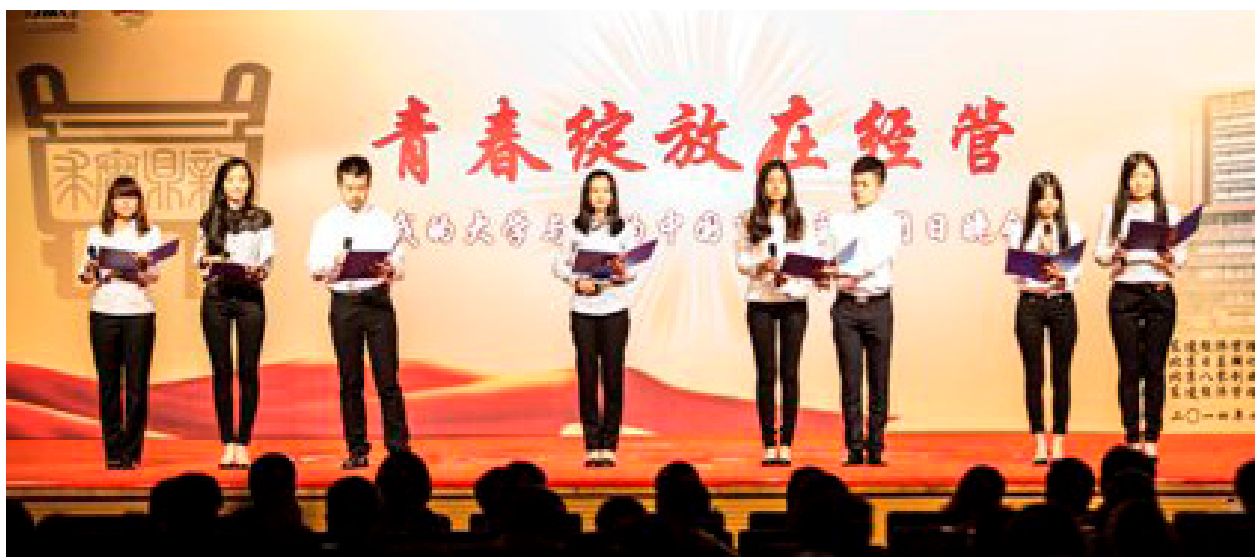
音乐剧《钢铁青年》再现校史诠释“勤学、修德、明辨、笃实”