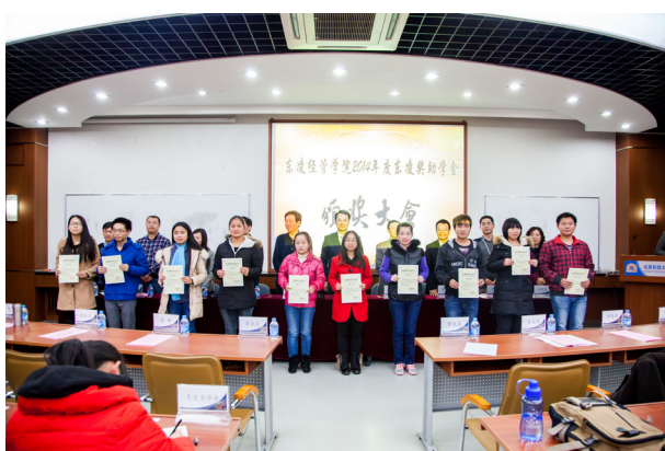
与会领导嘉宾为 2014 年度 东凌奖助学金获得者颁奖

引进和培养学术领军人才、激励学生健康成长成才、增强东凌经济管理学院服务社会能力和社会影响力方面发挥了重要作用。2014 年，“东凌基金”管理委员会面向各年级本科生继续实施奖助学金项目，其中新生奖学金每人次 5000 元，一等新生助学金每人次 6000 元、二等新生助学金每人次 4000 元、三等新生助学金每人次 3000 元，成长助学金每人次 4000 元、大四年级成长助学金 3000 元，共覆盖各年级本科生 108 人，对于解决学生经济困难、激发学生学习动力和爱校爱院之情均具有重要意义。