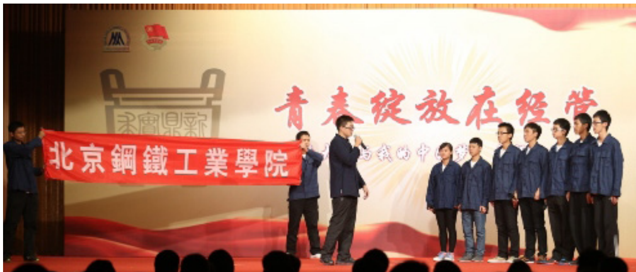
音乐剧《钢铁青年》再现校史诠释“勤学、修德、明辨、笃实”