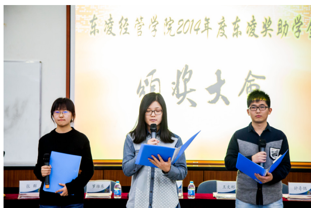
往届获奖助学金学生代表分享成长故事